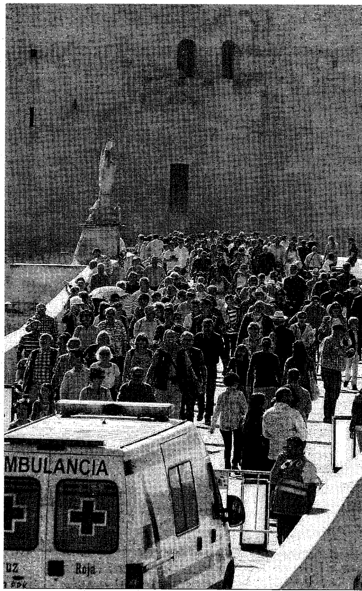
Una ambulancia en el Puente Romano durante la pasada Semana Santa.

El colectivo vecinal de Puente Romano lanzó la misma demanda a la Federación de Asociaciones de Vecinos Al-Zahara para que "igualmente solicite al Ayuntamiento" la