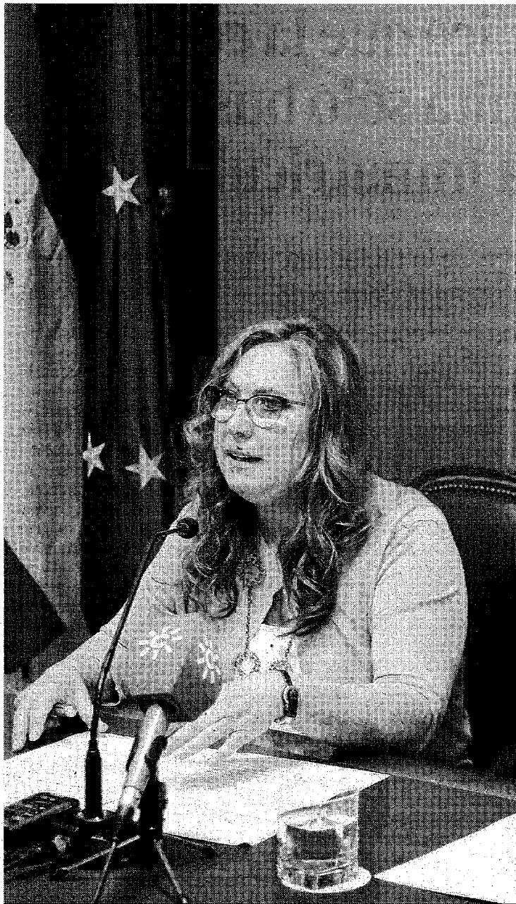
Luna ayer, durante la presentación de los talleres.

Díaz especificó que estos talleres se van a desarrollar durante todo el año, con un total de 24 por provincia, 12 de autonomía y empoderamiento y 12 para situaciones de ruptura. Cada taller durará dos meses, con una sesión de dos horas por semana, y serán de carácter grupal, con 20 participantes que deberán ser